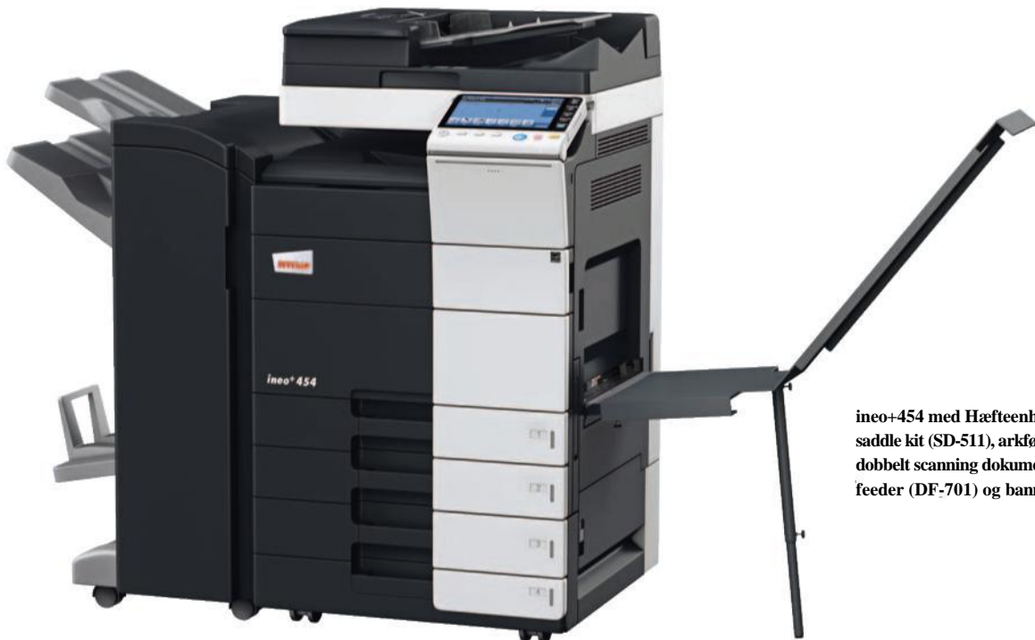
ineo+454 med Hæfteenhed (FS-534), saddle kit (SD-511), arkføder (PC-210), dobbel scanning dokumentfremfører feeder (DF-701) og banner tray (BT-C1e)