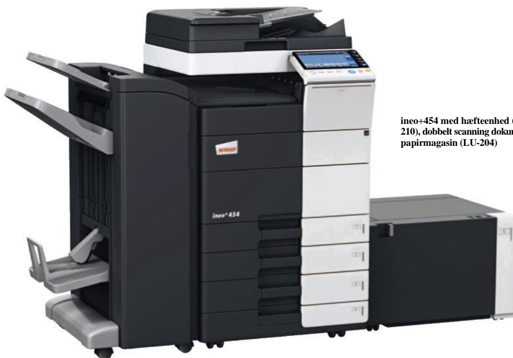
ineo+454 med hæfteenhed (FS-534), saddle kit (SD-511), arkføder (PC-210), dobbelt scanning dokumentfremfører (DF-701), og stort side papirmagasin (LU-204)

Den 9-tommers ”touchscreen” har velkendte funktioner som ”træk & slip”, og takket være en ny menu navigations struktur, kan man se alle funktioner på én gang, og vælg de ønskede indstillinger med blot nogle få klik. Ofte anvendte funktioner kan blive siddende på start-skærmen, og dem, du ikke bruger simpelthen fjernet. Det er den slags tilpasning, der vil spare jer masser af tid.