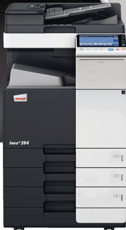
ineo+ 284 med arkfoder (PC-110) og dobbelt scan dokumentfoder (DF-701)