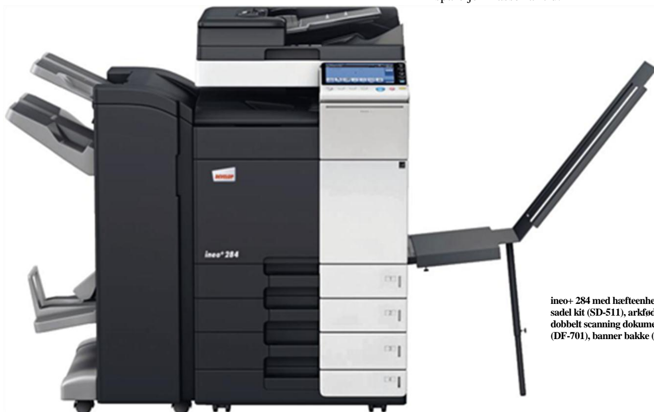
ineo+ 284 med hæfteenhed (FS-534) og sadel kit (SD-511), arkføder (PC-210), dobbelt scanning dokumentfremfører (DF-701), banner bakke (BT-C1e)

Enkelthed går igen i betjeningen af alle funktioner på ineo+284. Et intuitivt, let forståeligt betjeningskoncept sikrer, at det er lige så let at bruge ineo+284, som at bruge en smart-phone eller tablet. Den 9-tommers ”touchscreen” har velkendte funktioner som ”træk & slip”, og takket være en ny menu navigations struktur, kan man se alle funktioner på én gang, og vælg de ønskede indstillinger med blot nogle få klik. Ofte anvendte funktioner kan blive siddende på start-skærmen, og dem, du ikke bruger simpelthen fjernet. Det er den slags tilpasning, der vil spare jer masser af tid.